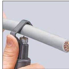
Umfangsschnitt Circular cut