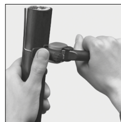
Umfangsschnitt Circular cut