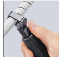
Wendelschnitt Spiral cutting