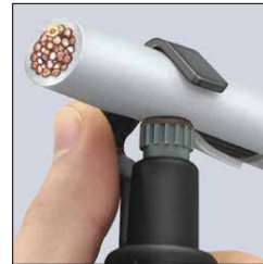
Langsschnitt Longitudinal cut