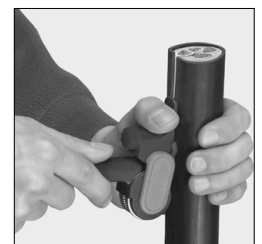
Langsschnitt Longitudinal cut